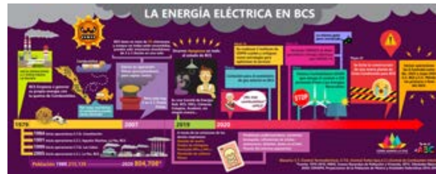
GALERÍA DE INFOGRAFÍAS SOBRE CALIDAD DE AIRE EN LA PAZ

Sólo da click en el link http://bit.ly/3rfBjAK